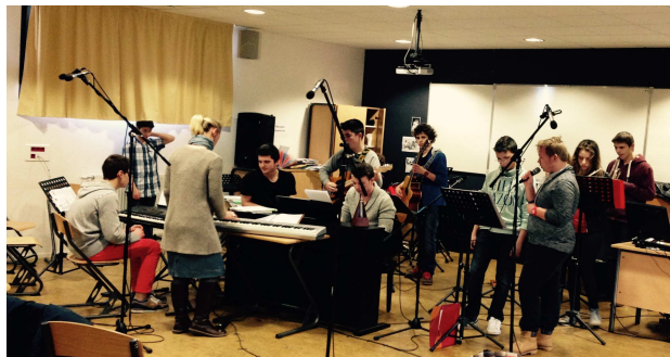
L'orchestre en pleine répétition

COLLEGE CAMILLE CLAUDEL SAINT-QUAY-PORTRIEUX